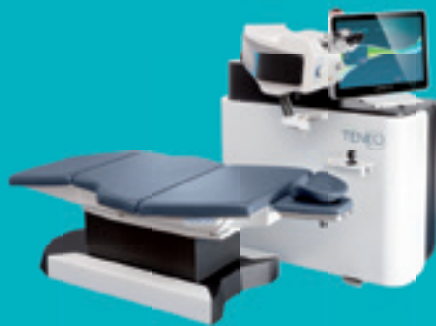
TENEO™ 317 Modell 2